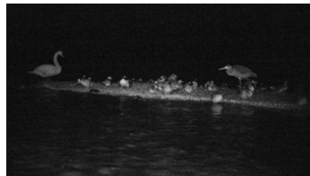
Tant diurne que nocturne, l'intense occupation de cet îlot pourrait avoir dérangé la couvaison de la canne eider.

Cela a déjà bénéficié trois années à l'eider à duvet, même si cette fois, quelques jours avant la fin de la couvaison, la femelle a abandonné ses œufs, probablement suite à un dérangement.